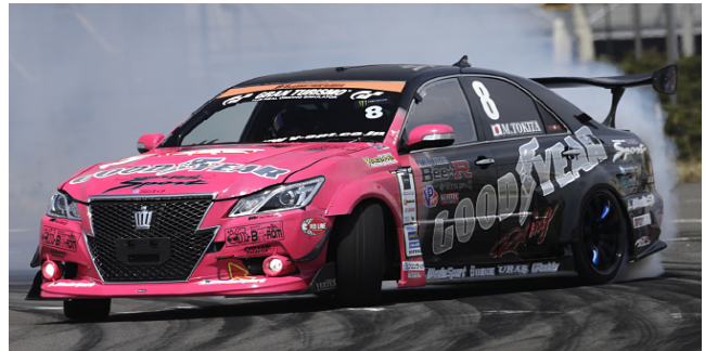
Kunihiko Teramachi (FD-JAPAN)