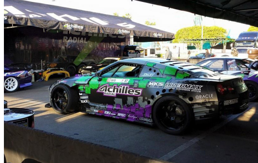
Robbie Nishida (FD-USA) (D1 -JAPAN) (FD-JAPAN)